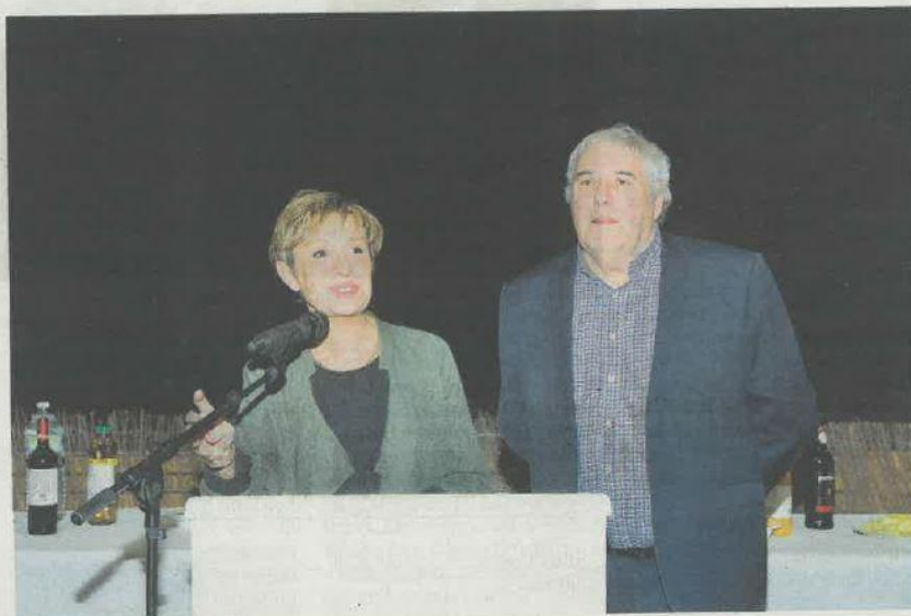
Pascale Got : « Il est toujours possible de concilier protection et innovation ».

Le lieu du rendez-vous n'a pas changé. Tous les ans, c'est à Castelnau-de-Médoc que Pascale Got, la députée socialiste de la 5 e circonscription, présente ses vœux. Jeudi soir dernier, la salle était pleine pour écouter la parlementaire. La députée, qui briguera un troisième mandat à l'Assemblée nationale, a commencé son discours en rendant