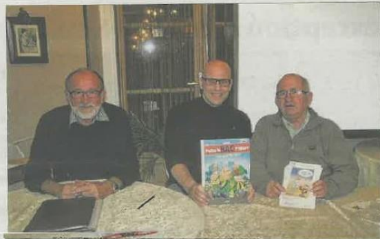
BDM 33 est à l'origine de multiples initiatives en direction de la jeunesse, mais aussi des adultes.