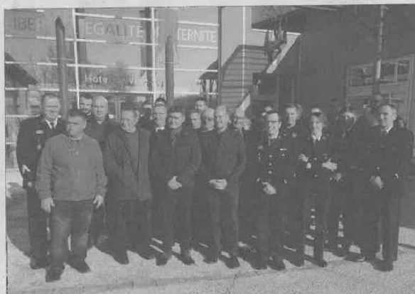
Les militaires de la brigade de gendarmerie de Castelnau entourée des pompiers, policiers et élus.

En ce qui concerne le bilan, les résultats sont stables sur la circonscription. Près de 2.200 procédures ont été engagées (procès-verbaux d'enquêtes judiciaires pour plus de la moitié) sur 2016. Quant aux