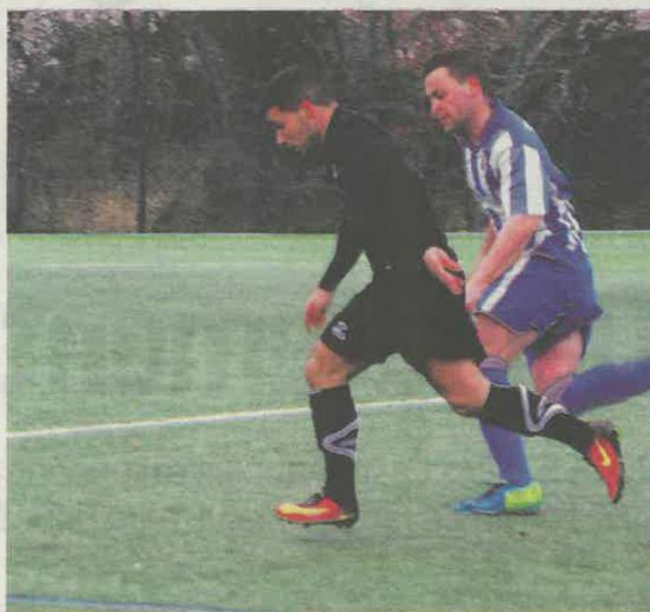
Arsac Le Pian (en noir) voudra gommer sa défaite face à Bassens (en bleu).

Sainte-Hélène réalise le difficile déplacement de Saint-Pierre-d'Irube, un leader bien ancré en tête de la poule. Pour les Écureuils au be-