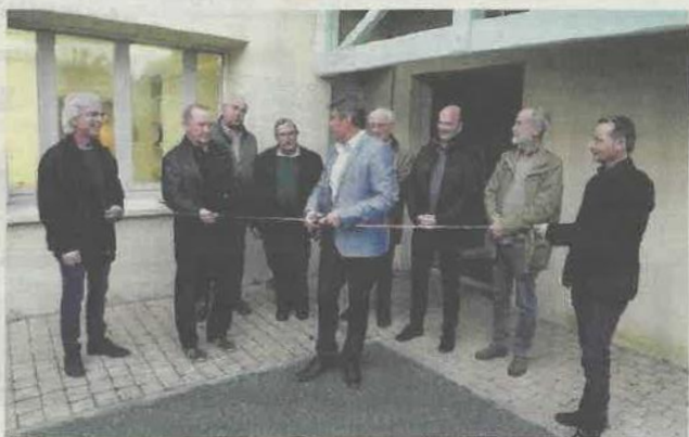
Le président Lagarde a coupé le ruban tricolore, symbole de l'inauguration.