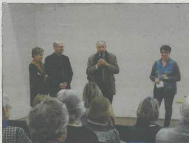
Les élus présents pour cette conférence sur les zones humides en Médoc.

Les spectateurs ont pu aussi découvrir les missions des Syndicats de bassin versant qui ont pour but de préserver et d'améliorer la qualité des eaux et la gestion des milieux aquatiques et en particulier