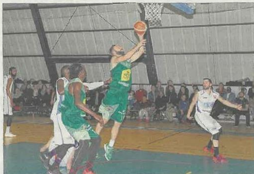
Le CBC a remporté le match du 11 février contre Panazol Feytiat.