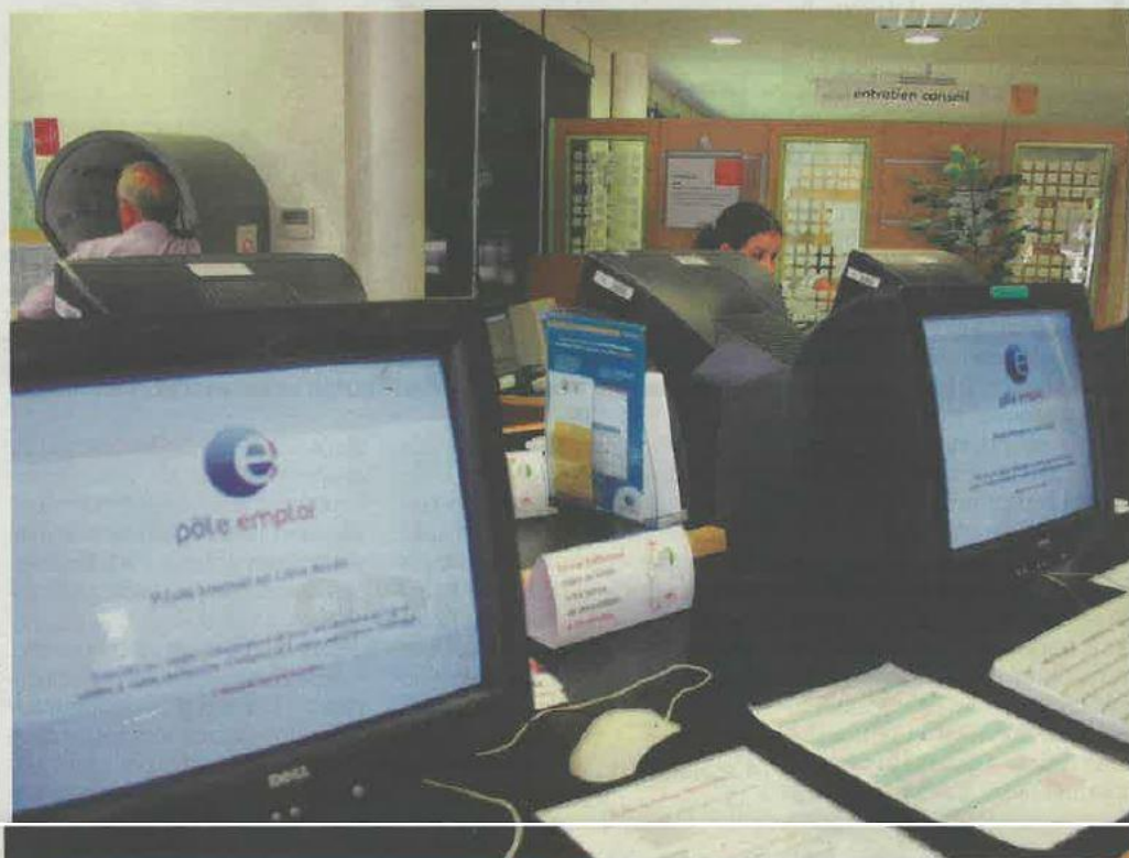
Pôle emploi déménage à Lesparre pour être au plus près des demandeurs d'emploi.

Avec cette opération, nous nous rapprochons du Nord-Médoc, qui est très éloigné de Pauillac. Pour