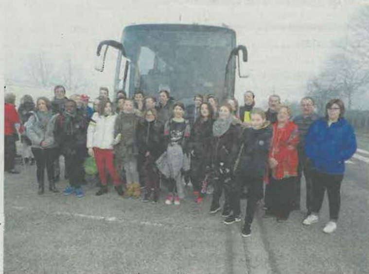
Photo de famille avant de monter dans le bus.