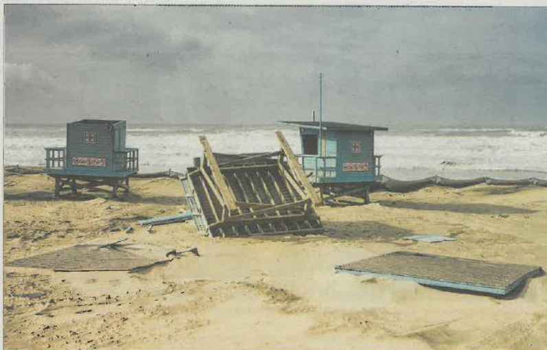
Une tour de sauvetage a été soufflée par la tempête Leiv sur la plage de Montalivet.

Les dégâts ont été nombreux, mais ils ont été relativement limités par rapport à ce que l'on pouvait craindre suite à l'annonce de Météo France qui, dès le vendredi après-midi, avait placé le département de la Gironde en vigilance rouge pour vents violents. Les Médocains