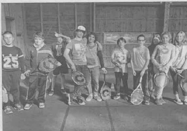
Un groupe de jeunes en activité tennis lors des dernières vacances.

À noter que pour les plus sportifs, trois jours de stage sont organisés les 20, 21 et 22 février par la structure de Castelnau autour de la boxe