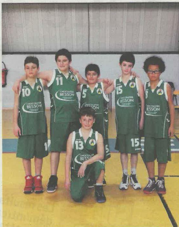
Une des équipes poussins du Castelnau BC.

Les cadets 1 de Patrick jouent en niveau 1. Une seule défaite entache leur bon parcours. Les cadets 2, en niveau 2 (réglementaire), domi-