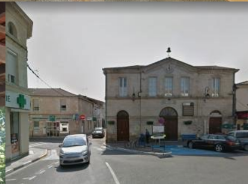
Place Aristide Briand Lavoir de Landiran