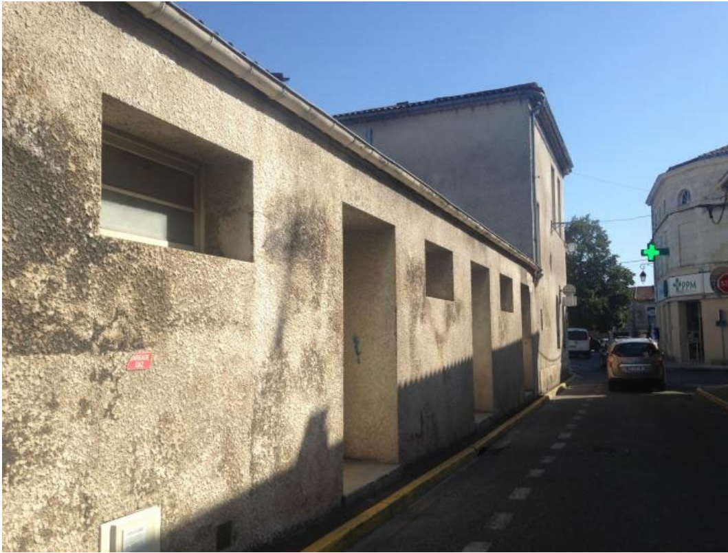
La salle des fêtes accolée à l'ancien hôtel de ville