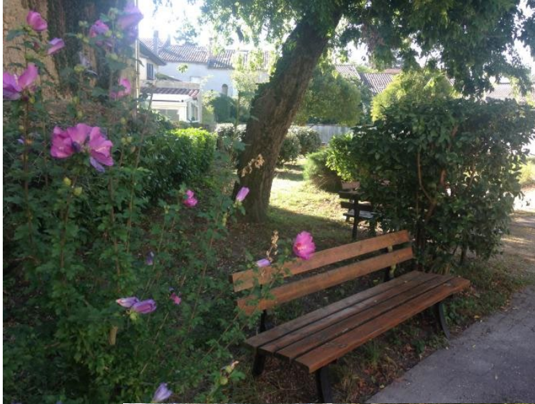
Le jardin confidentiel de la bibliothèque La Jalle en bordure du parc