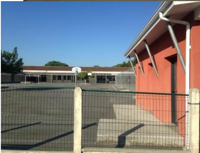
Le parking à vélo et la cour de l'école primaire