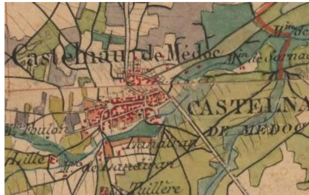
Carte de l'état major 1820 Le bourg s'est développé vers l'est, la Jalle constitue une frontière indépassable.