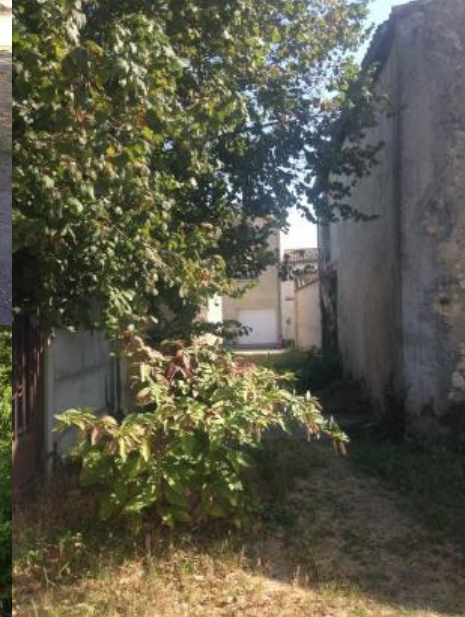
Le pré du château Liaison piétonne ouverte au bout de l'allée des marronniers