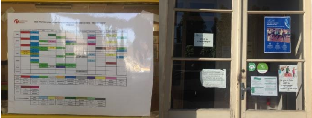
Planning d'occupation des salles de l'ancien collège

Les habitants, les associations & les services