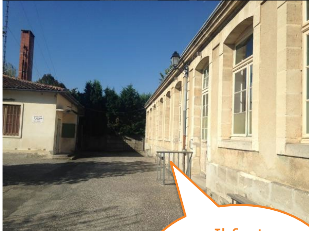
Place Romain Videau Ancien collège