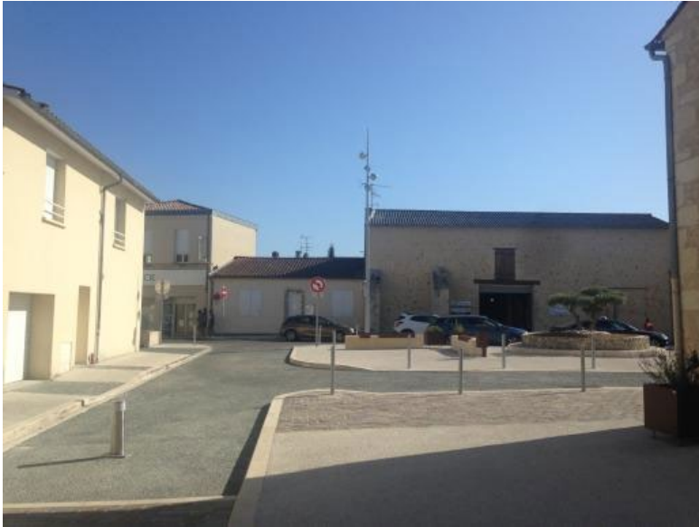
La place de l'église rénovée récemment La ruine en face de l'église propriété de la commune