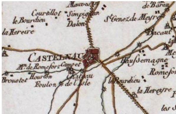
Carte de Cassini Le bourg historique de Castelnau clairement identifié au nord de la Jalle.