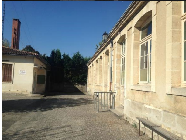
Place Romain Videau Ancien collège