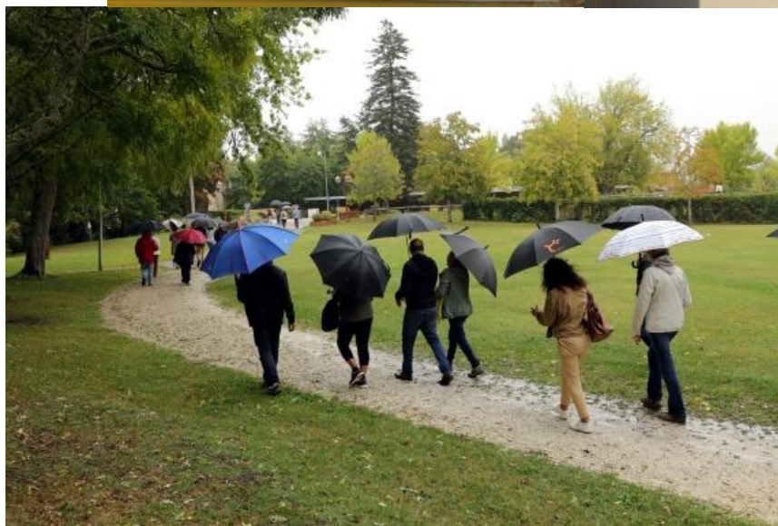
Le prés du château

Planning d'occupation des salles de l'ancien collège