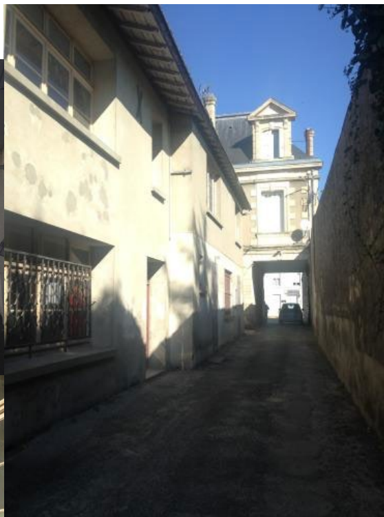
Porche d'entrée à l'ancien collège Rue de l'église