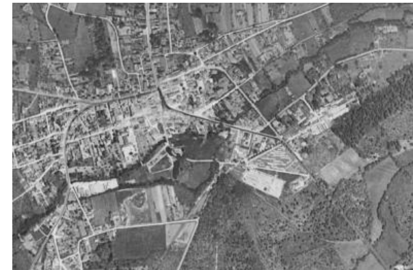
Photo aérienne 1950 Le bourg est compact et il y encore peu d'urbanisation pavillonnaire en extension.