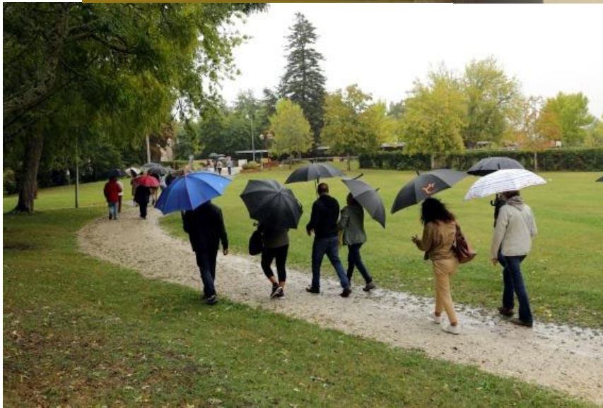
Le prés du château